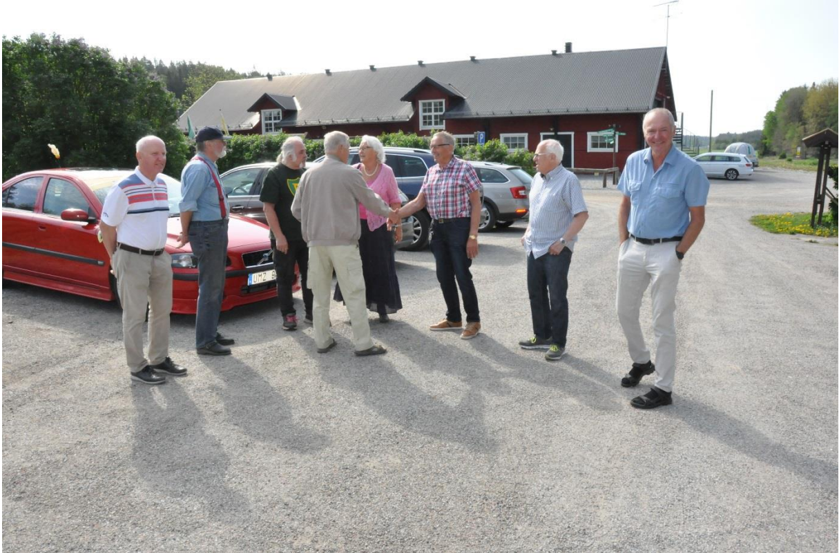
Samling vid Sättra Gård inför studiebesök på Glasbruket och Högbytorps återvinningsanläggning.