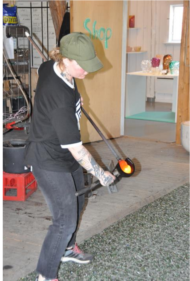
En glasblåsare in action !!!