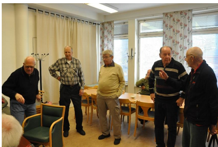
Men först den obligatoriska kaffetåren.