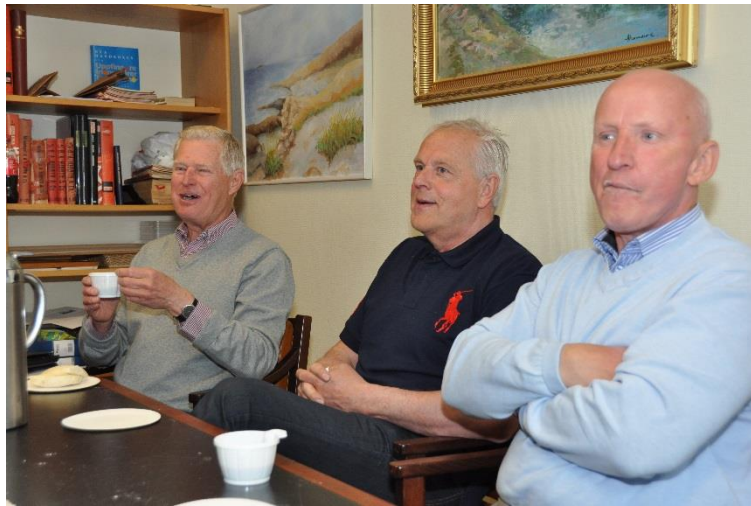
Tre nöjda kaffegäster