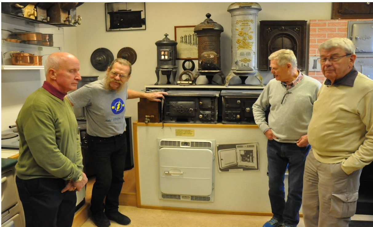
Några bilder som demonstrerar mångfalden i produktion.