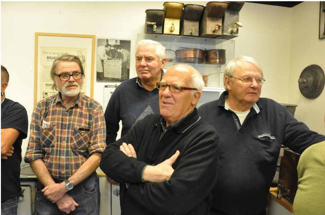
Ett gäng intresserade åhörare.