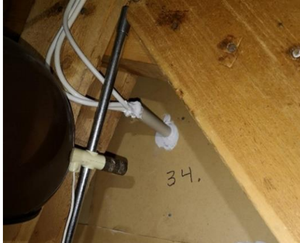
Figur 3 - Exempel på en tätad genomföring.

Samtliga genomföringar genom brandcellsavskiljande väggar måste tätas på ett godkänt sätt så att genombrottet inte försämrar byggnadsdelens brandmotstånd, se figur 8. Väggar och tak bör kontinuerligt kontrolleras för otätheter/brister vilket kan uppstå vid exempelvis nya kabeldragningar, installation av spotlights, ventilationskanaler etc. Tätheten på väggar och tak kan kontrolleras med en stark ficklampa. Eventuella otätheter ska tätas så att det brandtekniska skyddet mot brand uppfylls. Vid säkerhet, välj minst 60 minuter och låt en fackman utföra arbetet.