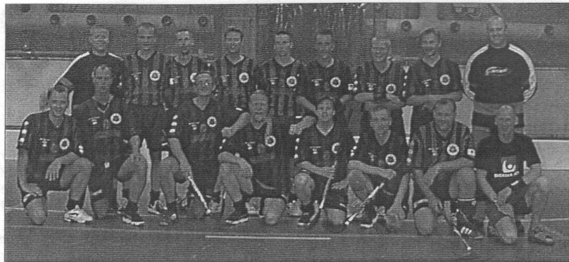
Som synes glada innebandy grabbar som inte klarade sig ända fram men som föll med flaggan i topp ! (floskelvarning)