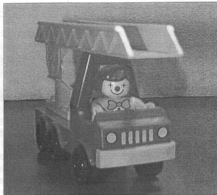
Så här ensam kan en Attunda brandis känna sig vid framkörning och ankomst till en lägenhetsbrand.