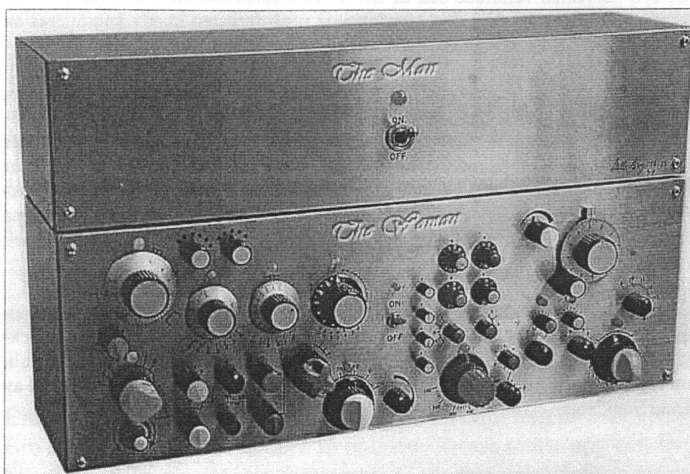
En bild säger mer än tusen ord. Många är de som nickar instämmande när de ser denna bild. Jag fick den tillskickad av Per Weimerbo, numer lyckligt bosatt i Ystad.

Dysterkvistare är alltid kul att dela med sig av. Följande åsikt luftades vid tal om den retroaktiva lön som kommer betalas ut i januari (6750 kr). - Å fy fan vicken skatt det blir den månan!