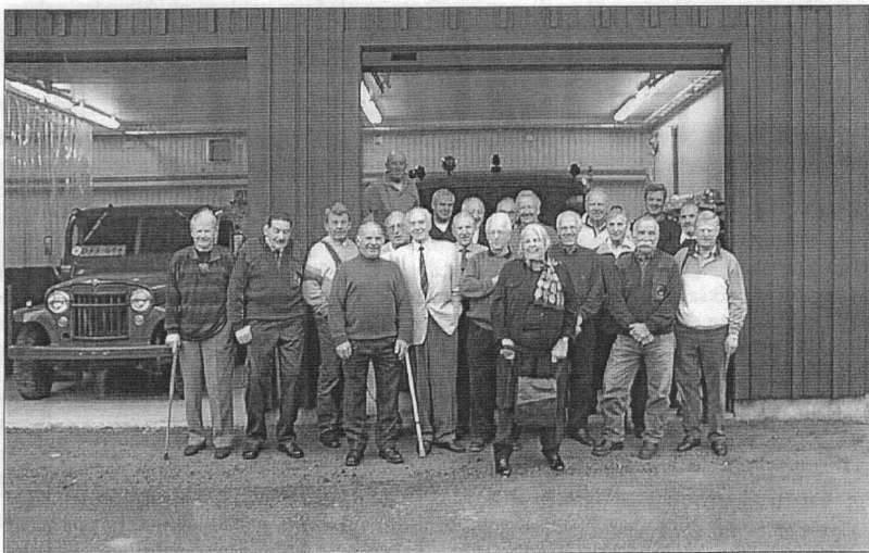
Så här glada ser våra pensionärer ut när de träffas och får vara med i Löpelden.

kan med enkla åtgärder logga in på intranätet var man än befinner sig och därmed komma åt all information som man saknat under sin ledighet. Givetvis kan man då också kolla sin post.