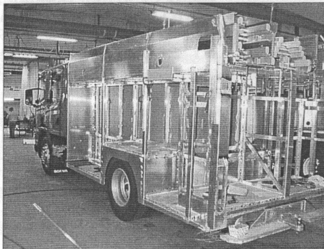
Här ser vi 601 från en helt annan vinkel. i Sala 29/11.

Hur och när varje grupp får denna utbildning planeras av Leif Sundström, och efter det finns väl något utrymme för gruppsvis övning för att därefter relativt raskt få ut bilarna på jungfrularmet.