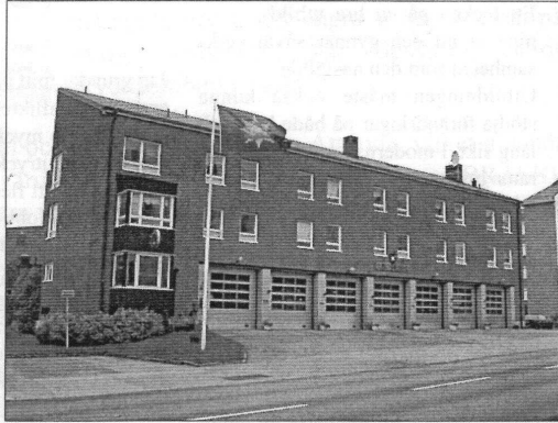
Järfälla stationen invigd 1962

Presentationerna talar för sig själva och om övriga innehållet finns inget att nämna. Slutligen en stilla förhoppning om att mina ord är färre i denna tidning än i den förra och ännu färre i nästa.